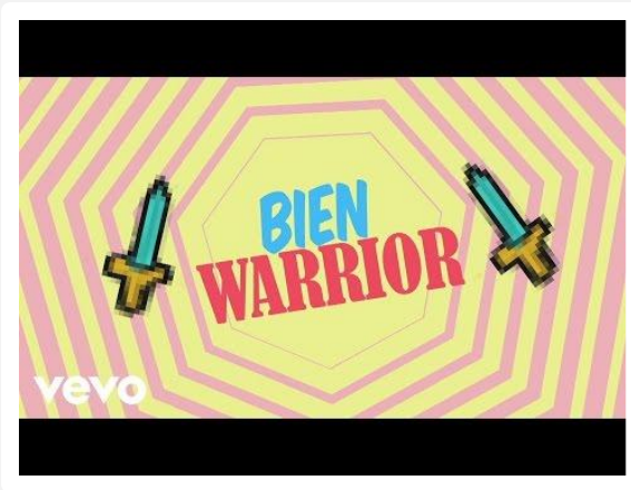
Bien Warrior. Miss Bolivia.