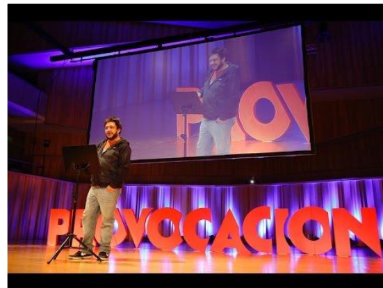
“Todo es un ensayo. Nadie te está mirando”. Hernán Casciari.