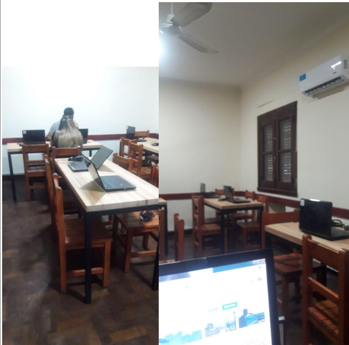
Imagen 4-5: Sala 1 de CRAIE

Esta zona fue adaptada para que estudiantes realicen trabajos individuales; de lectura; consulta de material bibliográfico a su alcance físico como así también digital, si lo requiere. Es una sala silenciosa ambientada con lo necesario para el estudio.