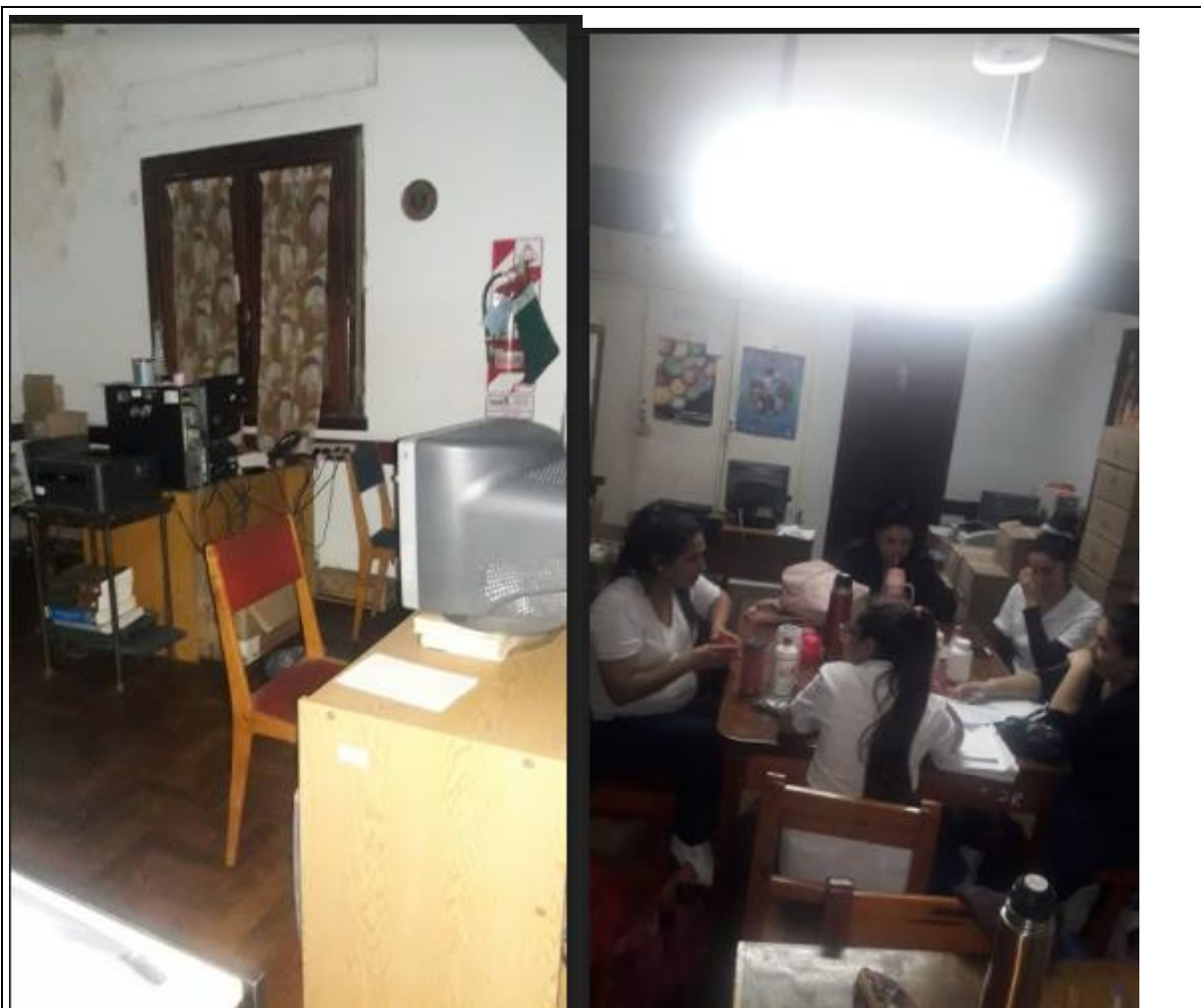
Imagen 7: sala de estudios antes de ser intervenida (desorden, mobiliario inadecuado, poco espacio)

Este espacio de 53 m 2 , fue equipado con mobiliario adaptado para trabajo grupal (mesas amplias, sillas, aire acondicionado)