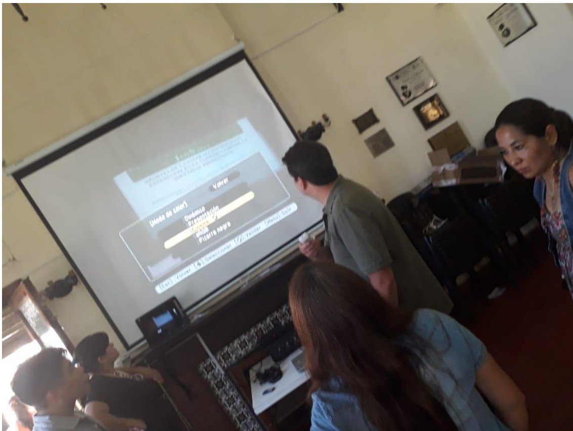
Imagen 10: Sala 3 “Salón de Usos Múltiples”

Se destinó un sector del Hall Central de la Institución, el cual fue adaptado para desarrollar actividades académicas.