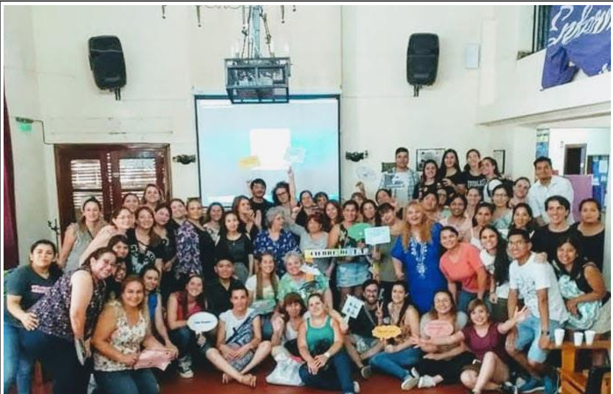
Imagen 12: Sala 3- actividad docente de Cátedra Taller de Trabajo Final