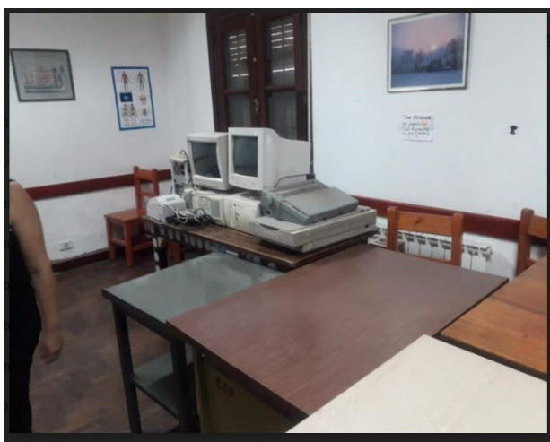
Imagen 3 : recursos obsoletos y mobiliario inadecuado