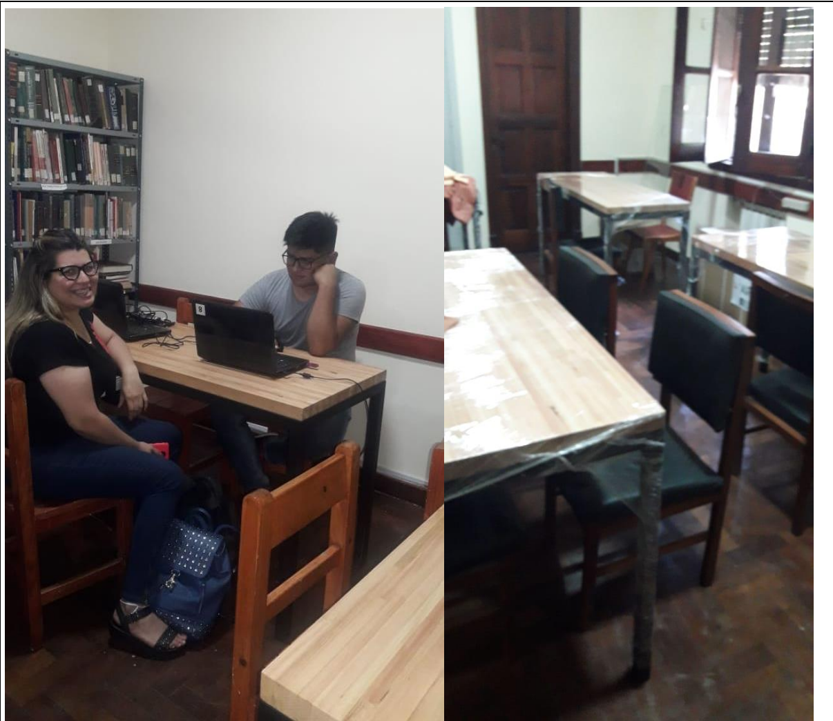
Imagen 8-9: nueva Sala 2 de CRAIE

Zona diseñada para el trabajo de los estudiantes de forma individual o en grupos. Es una sala de trabajo y aprendizaje cooperativo. Espacio de intercambio y socialización de recursos elaborados por los estudiantes: afiches, posters, presentaciones multimedia y todo aquello que cada estudiante desee compartir con sus pares. También desde esta zona pueden acceder a préstamos de libros/documentos de la biblioteca (físicos y digitales) para crear y/o compartir experiencias entre los estudiantes.