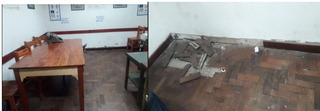
Imagen 1-2: piso en mal estado y paredes que necesitaban limpieza profunda y pintura.

Los espacios que serían destinados al CRAIE se ubicaban cercanos al acervo bibliográfico de la Escuela de Enfermería, y encontrados en muy mal estado general, según se observa en las imágenes: