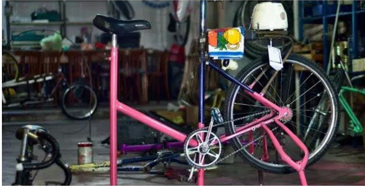
BICICUADORA Taller Popular de Ciclo Mecanica Suipacha