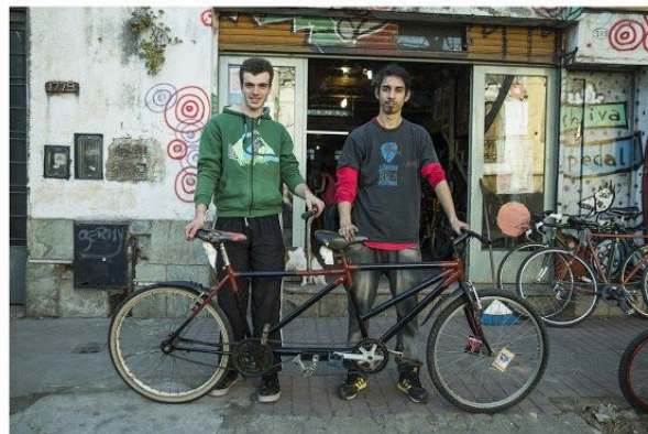
TANDEM Taller Popular de Ciclo Mecanica Suipacha