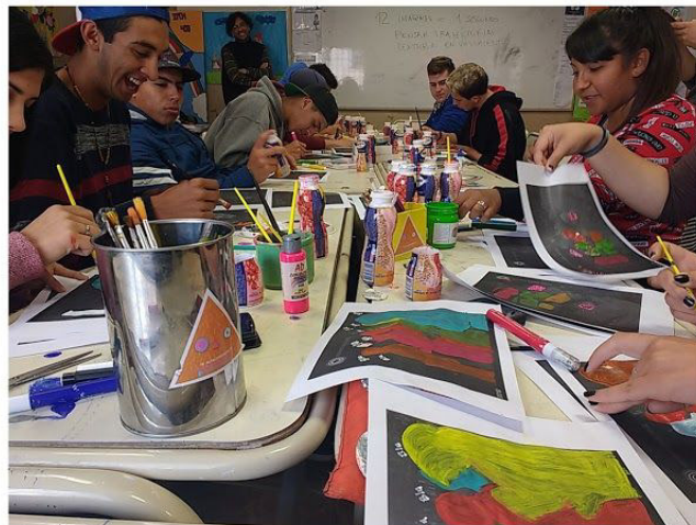
ANIMACION DE MEMORIA(S) Animaciones realizadas por estudiantes secundarios. Potaje Creativo 2017

Para ver animaciones: potajecreativo.com.ar/album/28