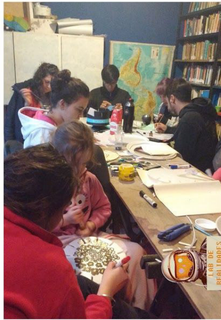
PRODUCCIÓN DE ANIMACIONES LAB DE REALIDADES Potaje Creativo 2017

Para ver animaciones: FB: El Taller de Animación