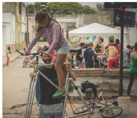
BICI SUPER ALTA+ Taller Popular de Ciclo Mecanica Suipacha