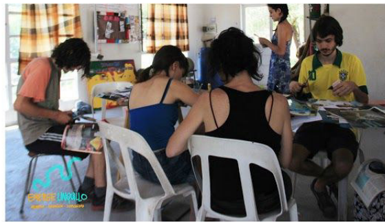
PRODUCCION DE ANIMACIONES RELATS COMUNITARIOS EMERGE Comunidad + Memoria+ Animación Potaje Creativo 2016

Para ver animaciones: FB: El Taller de Animación