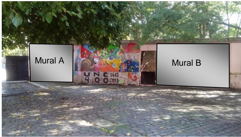
c) Pared Interior del Comedor Universitario. Dimensiones 3m*3m. Ubicación: https://goo.gl/maps/e8FaJdqbWay .