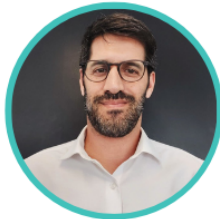
Juan Manuel Aranovich Dir. Nacional de Formación Cultural Ministerio de Cultura de la Nación