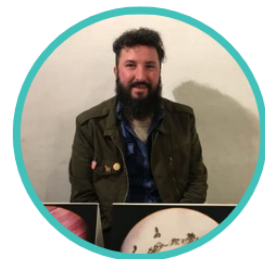
Juan Sequeira Dir. Cultura y Patrimonio Municipalidad de Córdoba