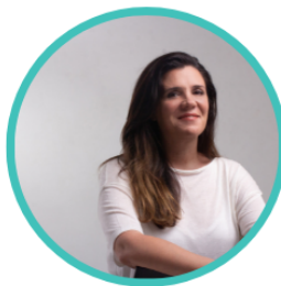
Lucrecia Cardoso Sec. de Desarrollo Cultural del Ministerio de Cultura de la Nación